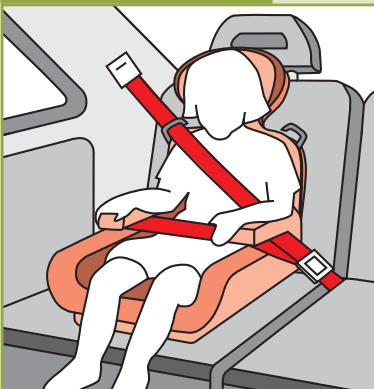
Sitzerhöhung mit Schlafstütze