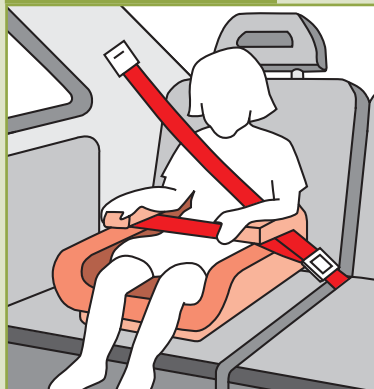
Sitzerhöhung ohne Schlafstütze